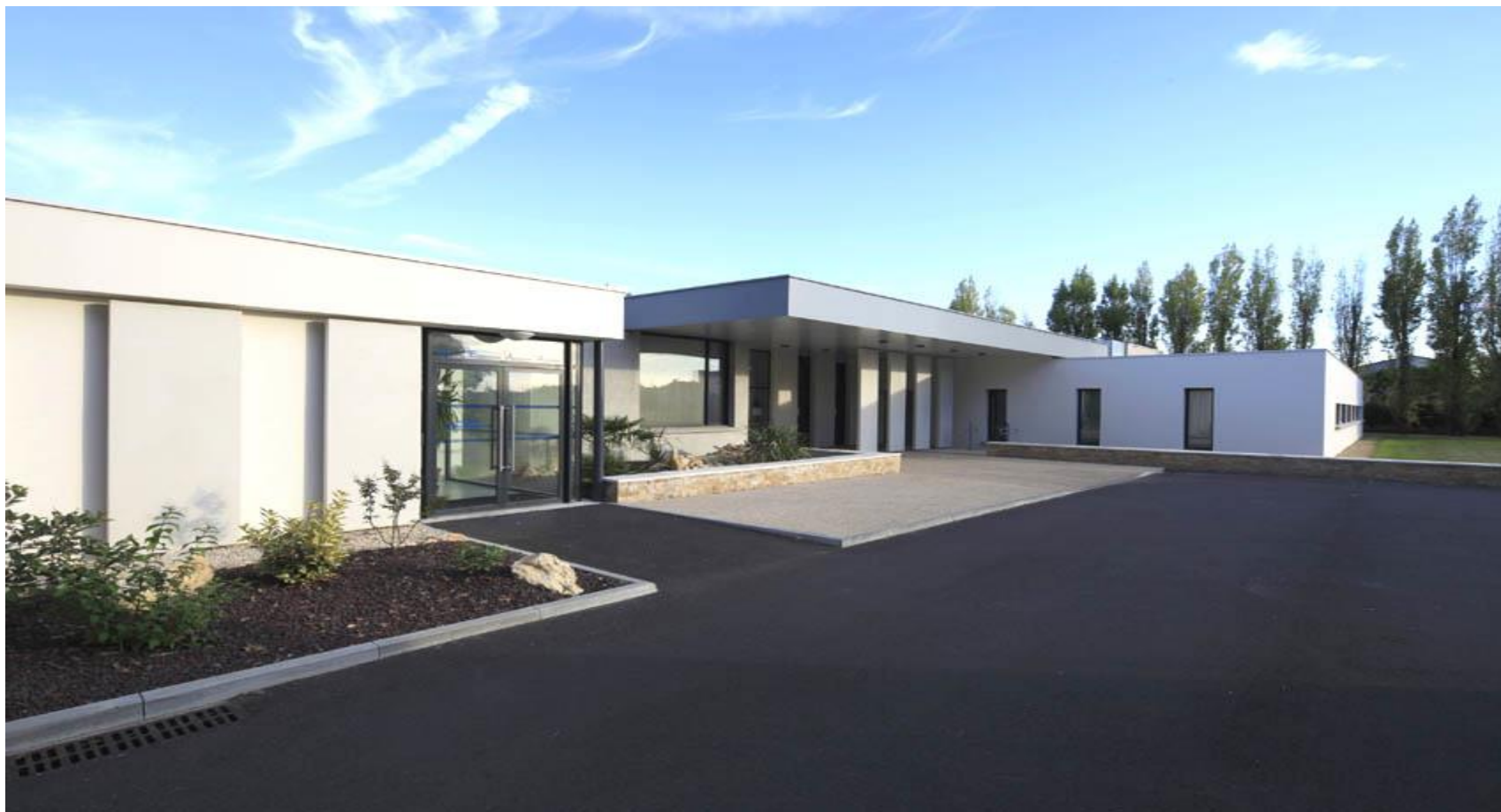
Centre Expertise Autisme Adultes